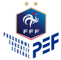
SENSIBILISATION À L'ARBITRAGE