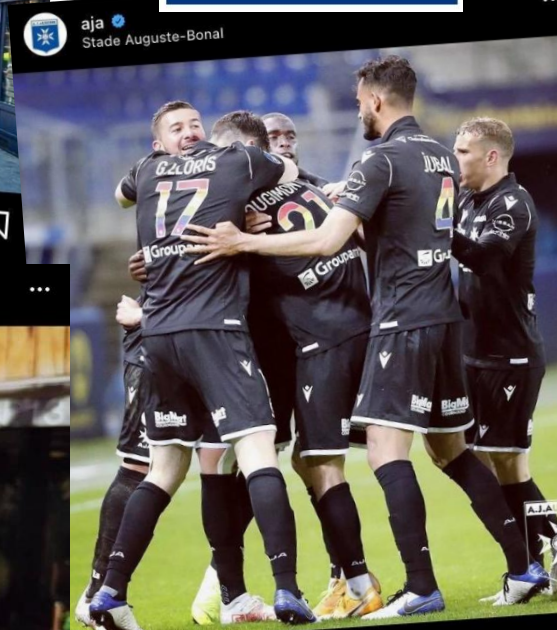
aja · Stade Auguste-Bonal Aimé par christophecailliet et 985 autres personnes aja 🏆 Une victoire renversante et haute en couleurs 🌈 #AJA #AJAuxerre #T #ligue2bkt #football #championship #vic #fcs #football #p #endofseason