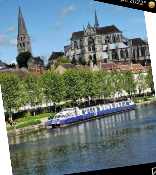
Aimé par yonni.bktsht et 253 autres personnes auxerroistourisme La semaine commence sous le soleil. Avez-vous profité de ce beau temps pour vous promener sur les quais tout comme @fabia1802 ? 🤩 🌊 🚤 #Auxerroistourisme