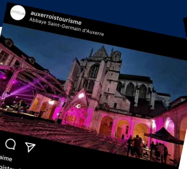
auxerroistourisme Quai De L'yonne 141 J'aime auxerroistourisme Quand l'abbaye Saint-Germain reçoit le festival "En attendant Catalpa 2022" 🤩