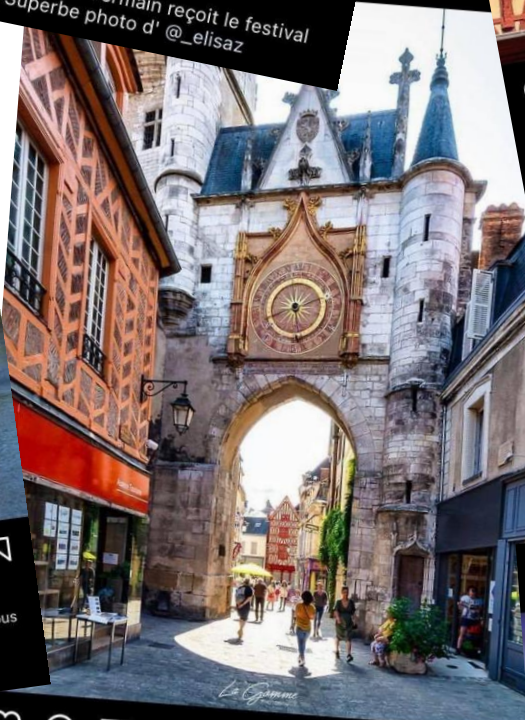
welovebourgogne · S'abonner Auxerre - Yonne (89) - Bourgogne 3088 J'aime la_gomme hello.diit · S'abonner Auxerre