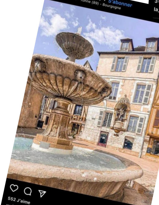
welovebourgogne [#REPOSTOFTHE DAY] 552 J'aime La place Saint-Nicolas et sa fontaine rayonnent grâce à la photo de @carlarglm 🤩 🌞 🏰 Nous souhaitons un bon week-end à tous les #igersbourgogne !