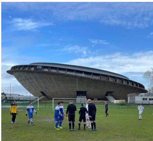
: La salle de Soucoupe pour les repas