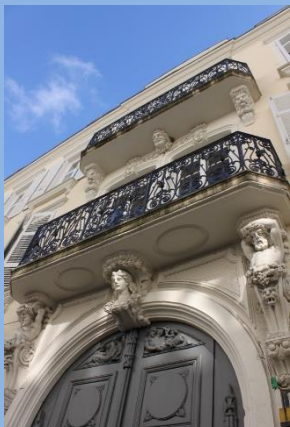
Rue de la Banque

A Chalon sur Saône, le jeudi 27 septembre 2018