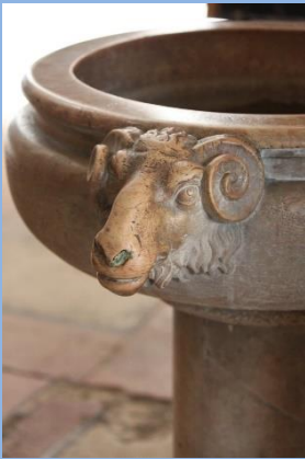
Cathédrale Saint Vincent

de la ville de Chalon sur Saône organisent