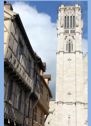
Place Saint Vincent