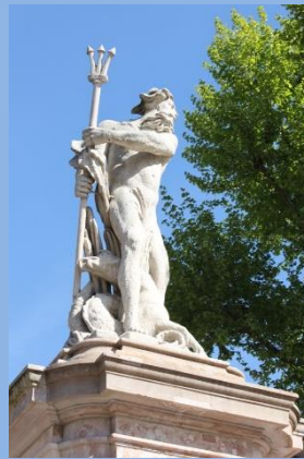
Place de Beaune