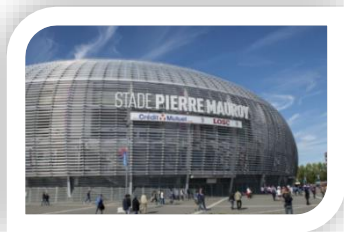
Stade Pierre Mauroy