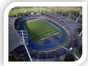
Stadium Lille Métropole